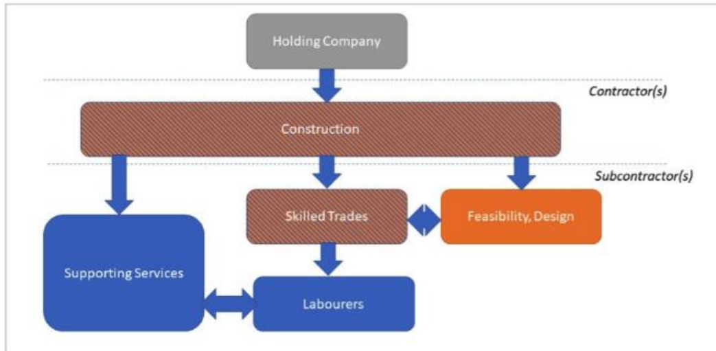
Rajah 3: Struktur tipikal bagi projek pembinaan infrastruktur di Malaysia (Todd & Slattery, 2018)

Dapatan kajian Todd & Slattery (2018) menggambarkan meskipun syarikat tempatan berjaya mendapat kedudukan di peringkat syarikat induk melalui pemilikan bersama dengan syarikat dari China, syarikat-syarikat dari China sering diutamakan pada peringkat kontraktor dan subkontraktor. Keutamaan ini dikaitkan dengan beberapa faktor seperti keupayaan syarikat China untuk mengendalikan projek berskala besar, menyediakan harga yang kompetitif dengan margin yang rendah, kemahiran dan perbezaan amalan kerja pekerja China dan tempatan, perbezaan budaya, halangan bahasa, kapasiti syarikat tempatan untuk memenuhi permintaan projek, dan agenda kerajaan China yang ingin memaksimumkan peluang ekonomi untuk warga China.