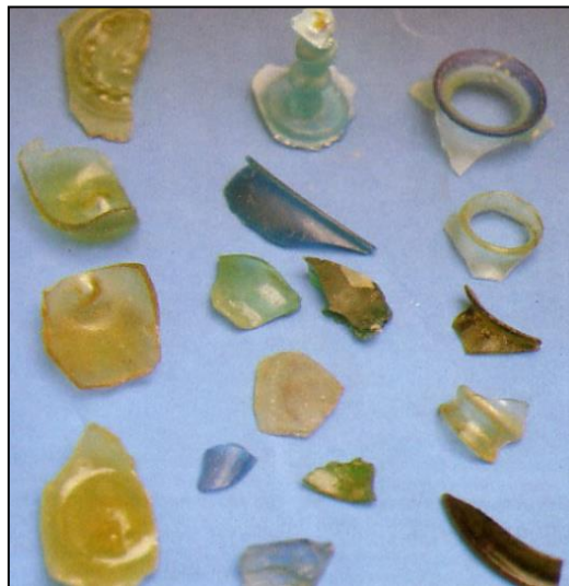
Rajah 4: Serpihan kaca yang dijumpai di Lembang Bujang yang datang dari Timur Tengah (Zuliskandar Ramli & Nik Hassan Shuhaimi Nik Abd. Rahman, 2009).

Empayar Melayu Srivijaya juga telah membina hubungan perdagangan yang kuat dengan dunia Arab-Parsi. Menurut Qin dan Xiang (2011:19) yang melakukan kajian terhadap laluan maritim semasa era kegemilangan Srivijaya, terdapat tiga lingkungan hubungan perdagangan yang telah wujud (Dellios & Ferguson, 2015). Pertama, China dan Asia Tenggara (Alam Melayu), seterusnya Alam Melayu dan Arab serta Teluk Parsi, dan yang terakhir ialah antara Arab dan Afrika Timur (Dellios & Ferguson, 2015). Dua titik penting yang menyambung ketiga-tiga lingkungan ini adalah Srivijaya di Alam Melayu dan Basrah di Iraq yang merupakan ibu kota pemerintah Khilafah Abbasiyyah yang berperanan sebagai titik penting hubungan perdagangan maritim pada masa itu (Dellios & Ferguson, 2015).