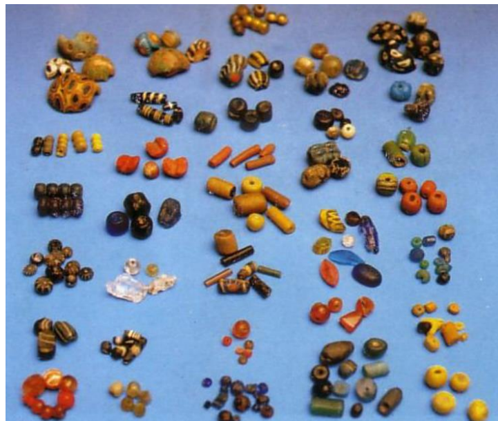
Rajah 2: Manik yang berasal dari Timur Tengah, India dan buatan Alam Melayu di Lembah Bujang, Kedah (Zuliskandar Ramli & Nik Hassan Shuhaimi Nik Abd. Rahman, 2009).

Kerajaan Melayu Champa juga menyimpan fakta yang memperkukuhkan berlakunya hubungan yang kuat antara Alam Melayu dan dunia Arab. Telah wujud kelompok pedagang Arab di satu kawasan penempatan yang terletak dalam wilayah Phanrang, di Champa (Federspiel, 2007). Pada masa itu juga terdapat peraturan dan undang-undang khas untuk percukaian dan pembayaran hutang, di wilayah Phanrang yang dipercayai terkesan oleh prinsip syariat hasil kedatangan pedagang Arab yang beragama Islam tersebut (Federspiel, 2007).